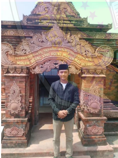
Gambar 12 Masjid dan Maqam di mana seratan manuskrip berasal