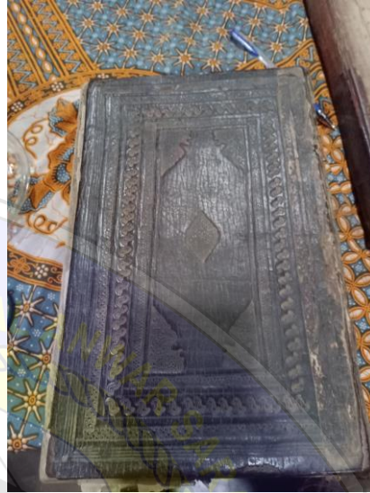
Gambar 11 Fisik Manuskrip Muhammad Asror